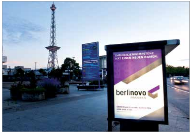
^ City Light Poster

Intern wurde der Prozess durch das „One Company Team“ gesteuert, das die rechtlichen und organisatorischen Veränderungen durch den Anstoß eines internen Kulturwandels flankierte. Damit wurde der Weg zum markt- und zukunftsorientierten Immobilienunternehmen auch für die Mitarbeiterschaft glaubwürdig und nachvollziehbar kommuniziert.