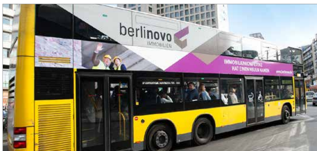
^ Kampagne zum Einführung der neuen Dachmarke: Busbranding

2012 war vor allem auch das Jahr des erfolgreich abgeschlossenen Markenrelaunches der berlinovo und der Verschmelzung der ehemaligen Berliner Immobilien Holding (BIH) mit ihren bisherigen operativen Tochtergesellschaften.